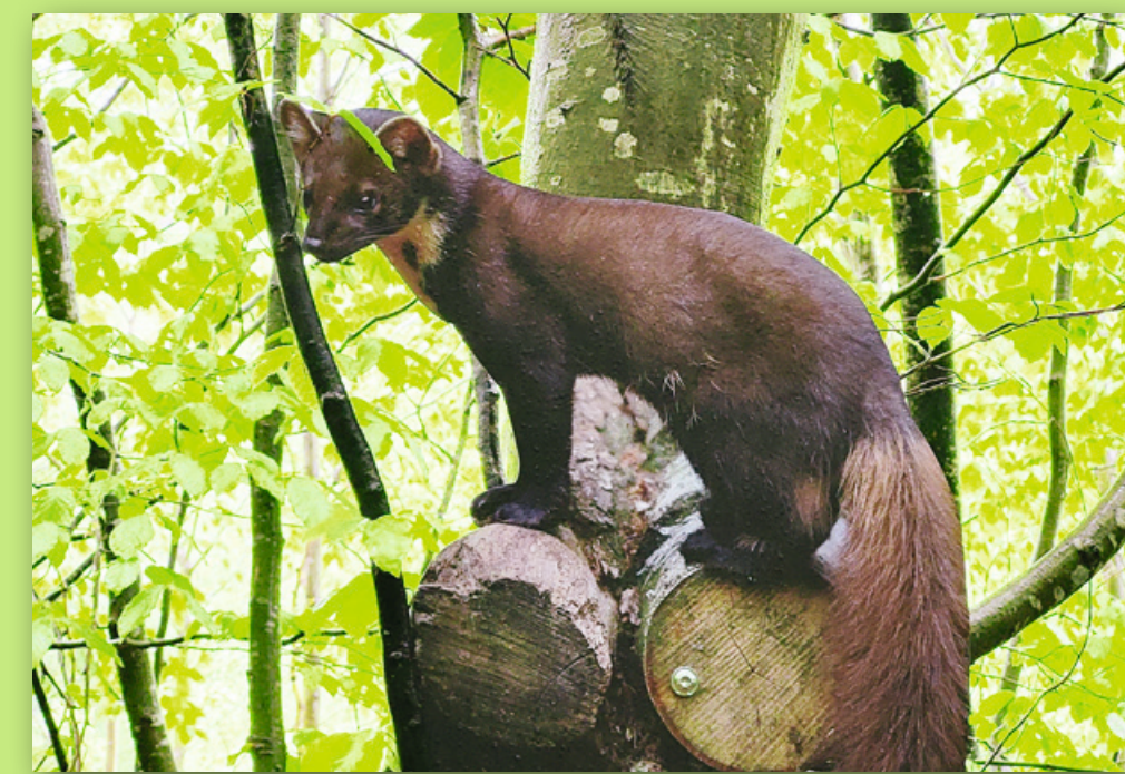
Waldtiere am Pirschpfad