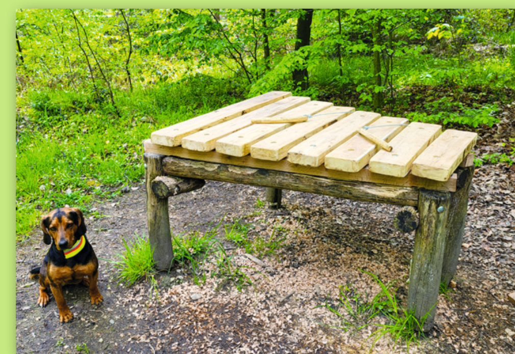
Klangstation mit Xylophon