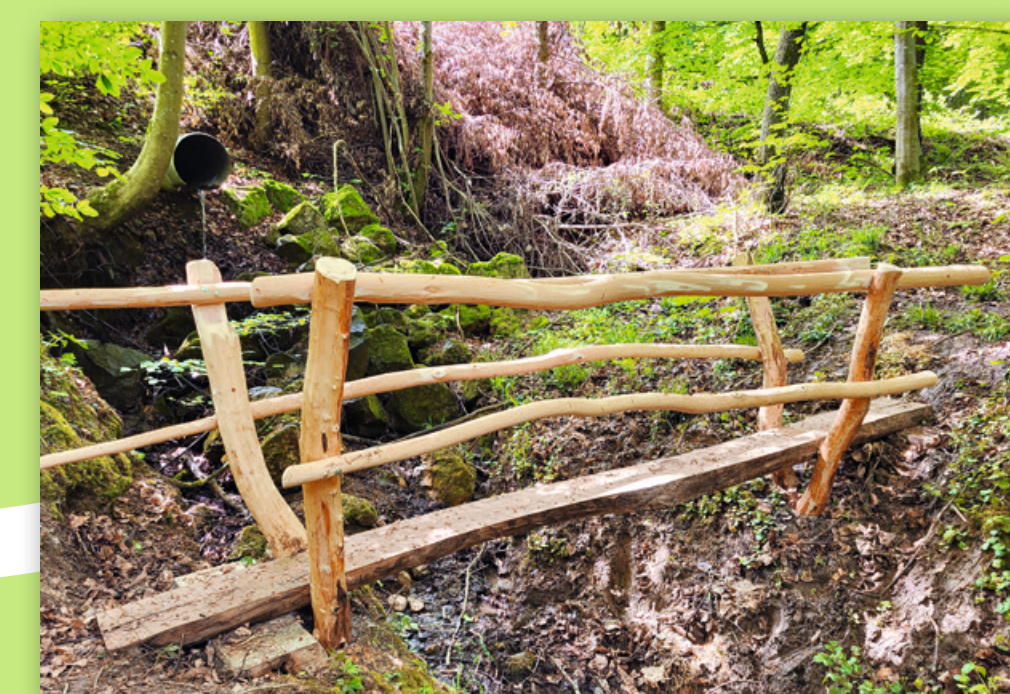
...Pfade und Brücken führen durch den Wald...