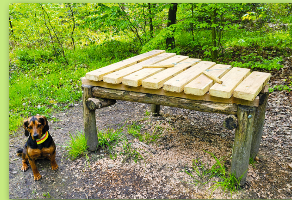
Klangstation mit Xylophon